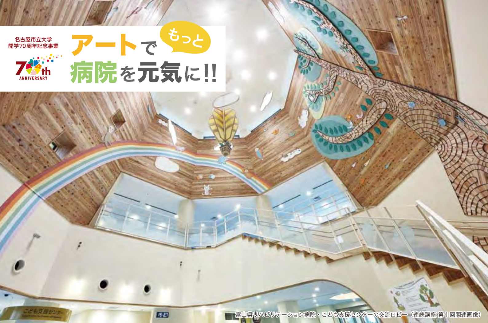
富山県ツハビワテーション病院・こども支援センターの交流ロビー（連続講座第1回関連画像）