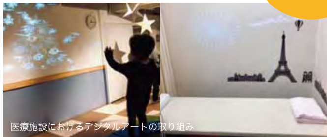
医療施設におけるデジタルアートの取り組み