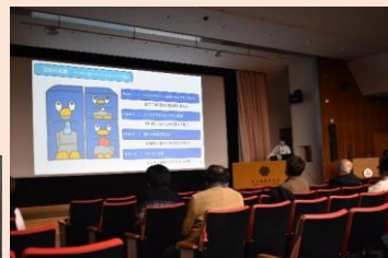
名古屋市立大学の学生によるSDGs達成に向けた取組み発表