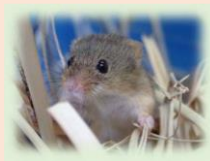
カヤネズミ 名古屋市版レッドリスト2020において 絶滅危惧 I B類

名古屋の生きものやレッドリストをはじめ、生物多様性に関する最近の話題が、専門家や高校生・大学生等から提供されます。