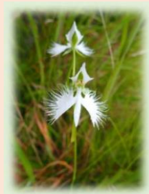
サギソウ 名古屋市版レッドリスト2020において 絶滅危惧 II 類

日時：3月24日(日)13:00～17:00 場所：田辺通キャンパス 宮田専治記念ホール 定員：200名(当日先着順) 料金：無料 主催：生物多様性研究センター、名古屋市環境局なごや生物多様性センター 協力：SDGsセンター、なごや生物多様性保全活動協議会