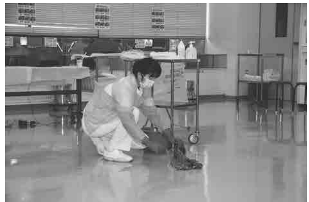
[演習室] ノロウイルス感染症を想定した汚物処理(デモンストレーション)