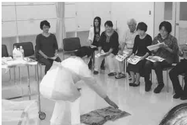
[演習室] ノロウイルス感染症を想定した汚物処理(デモンストレーション)