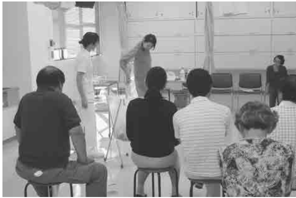
[演習室] 参加者の実践の様子