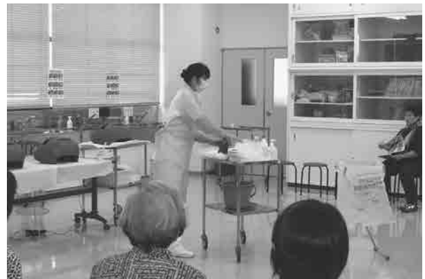
[演習室] ノロウイルス感染症を想定した汚物処理(デモンストレーション)