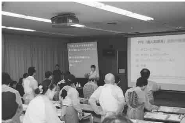
手話通訳・要約筆記の様子